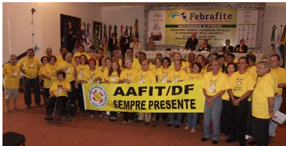
AAFIT é premiada por levar a terceira maior delegação de auditores tributários

Em junho, a FEBRAFITE realizou o VII Congresso Nacional e II Internacional. O evento reuniu mais de seiscentos associados em Natal, no Rio Grande do Norte, para discutir o tema “Fisco e Sociedade: quando todos reúnem forças, o resultado fica melhor”. Realizado durante os dias 7 a 10 do mês, a Associação dos Auditores Fiscais do Tesouro do Estado do Rio Grande do Norte (Asfarn/RN) também comemorou na ocasião o seu cinquentenário ano.